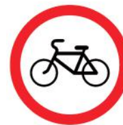
Знак 3.9 «Движение на велосипедах запрещено»

Если установлен такой знак, то водители не имеют права проехать по этой улице. Но есть исключение: они могут при крайней необходимости заехать на эту улицу, если им надо подвезти товар к магазину или въехать во двор близко расположенного дома.