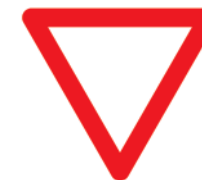
Знак 2.4 «Уступите дорогу»

Не спеши, не торопись, Вперёд внимательней взглядишь. И с педали газа убери-ка ногу – Знак говорит: уступи дорогу.