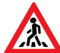
1.22 «Пешеходный переход»

Он предупреждает водителя, что поблизости находится детское учреждение или игровая площадка. И на проезжую часть могут неожиданно выбежать дети. Но этот знак не обозначает место для перехода!