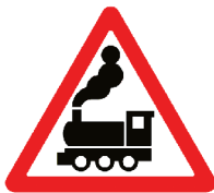
1.2 «Железнодорожный переезд без шлагбаума»

Эти знаки устанавливаются вблизи железнодорожных переездов. Они служат прежде всего для регулирования движения транспорта. Однако пешеходам в целях безопасности тоже нужно дожидаться, пока поезд проедет и шлагбаум откроется. Остановить мчащийся на полной скорости поезд ещё труднее, чем автомобиль, по-этому на переезде нужно быть вдвойне внимательными, и уж тем более не играть вблизи железной дороги!