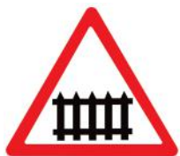
1.1 «Железнодорожный переезд со шлагбаумом»

Он не разрешает переход в том месте, где установлен. Этот знак для водителя. Он предупреждает, что впереди – через 50-300 метров будет пешеходный переход и надо снизить скорость.