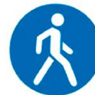
4.5 «Пешеходная дорожка»

Там, где он висит, смело можно ехать на любых велосипедах, даже на таких, которые снабжены моторчиком.