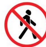
3.10 «Движение пешеходов запрещено»

Придётся либо искать другую дорогу, либо сойти с велосипеда и везти его, держа руками. Обычно этот знак устанавливается перед очень оживлёнными улицами и при въезде на автомагистраль, на которой движение для велосипедистов опасно.