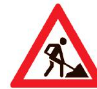
Знак 1.25 , на котором нарисован человек с лопатой, называется « Дорожные работы ».

Знаком обозначают участок дороги, где имеются опасности, не предусмотренные другими предупреждающими знаками. Характер «опасности» может быть детализирован дополнительной табличкой или надписью, которые, как правило, размещаются под знаком.