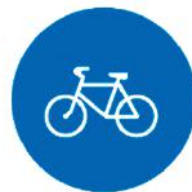
4.4 «Велосипедная дорожка»

Здесь машины друг за другом Мчатся весело по кругу. Что такое, в самом деле, Словно мы на карусели? Мы на площади с тобой, Где дороги нет прямой.