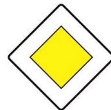
Знак 2.1 «Главная дорога»

Эти знаки устанавливают очередность проезда перекрёстков пересечения проезжих частей или узких участков дороги.