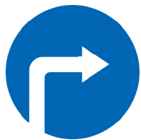
4.1.2 «Движение направо»

Знаки указывают направление движения по дороге, другие действия. Например, если стрелка на знаке указывает вправо, то здесь ехать надо только направо. Знак со стрелкой влево означает, что надо поворачивать налево. Знак, на котором изображена стрелка, смотрящая вверх, указывает, что здесь можно ехать только прямо.