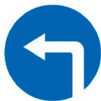
4.1.3 «Движение налево»

Стрелки, словно на распутье В сказке про богатырей – Прямо ехать, повернуть ли? Отгадай, дружок, скорей.