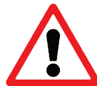
1.33 «Прочие опасности»

Этот знак устанавливается в местах, где недостаточен коэффициент сцепления шин с дорогой. От величины этого показателя зависит тормозной путь, который в плохую погоду непредсказуемо удлиняется. На скользком покрытии повышается и вероятность заноса. Поэтому в местах, где установлен знак 1.15, нужно быть очень внимательным и увеличить безопасное расстояние для перехода проезжей части. И не следует забывать, что осенью во время листопада, в плохую погоду – в дождь, снег, гололёд – все покрытия становятся более скользкими.