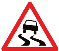
1.15 «Скользкая дорога»

Эти знаки устанавливаются вблизи железнодорожных переездов. Они служат прежде всего для регулирования движения транспорта. Однако пешеходам в целях безопасности тоже нужно дожидаться, пока поезд проедет и шлагбаум откроется. Остановить мчащийся на полной скорости поезд ещё труднее, чем автомобиль, по-этому на переезде нужно быть вдвойне внимательными, и уж тем более не играть вблизи железной дороги!